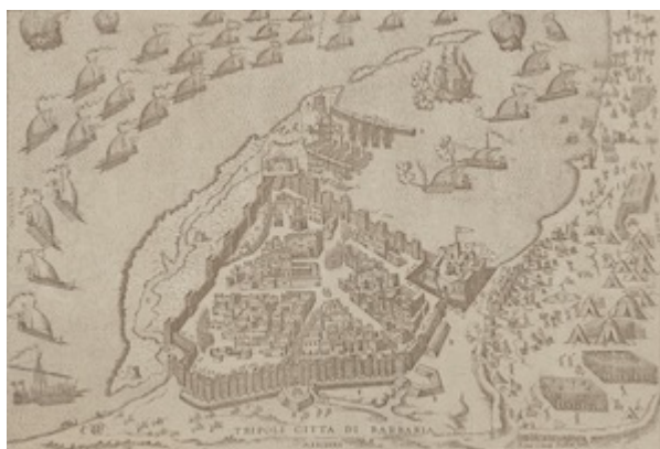
Tripoli citta di Barbaria