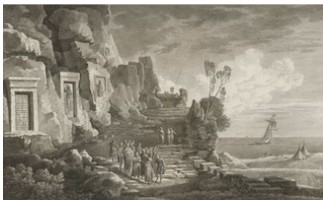
Estelas de Nahr al-Kalb. Louis-François Cassas (1799)