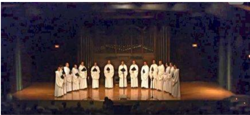
Salmo 94 y responsorio Libera me . Schola Antiqua. Músicas para bien morir. Réquiem . Fundación Juan March