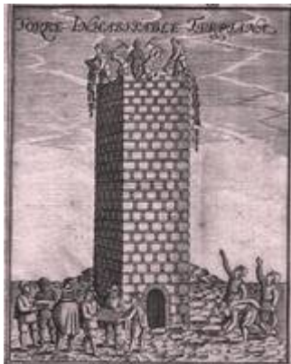
Torre Turpiana (alminar de la mezquita mayor). Francisco Heylan (siglo XVII)