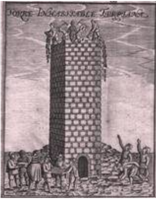
Torre Turpiana (alminar de la mezquita mayor). Francisco Heylan (siglo XVII)

"http://www.youtube.com/embed/Sdyb8ySwdmM?iv_load_policy=3&fs=1&origin=http://www.historicalsoundscapes.com"