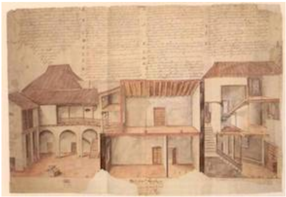
Demostración de la mitad sur de la cárcel pública de Sevilla. Madrid.