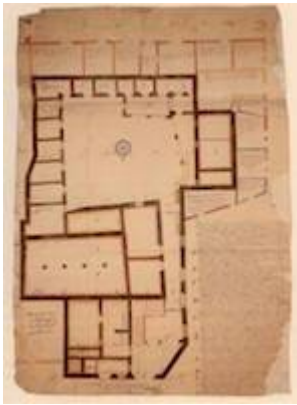
Planta de la cárcel pública de Sevilla. Madrid. Archivo Histórico Nacional

https://www.youtube.com/embed/MLb4ZVPRSy0?iv_load_policy=3&fs=1&origin=https://www.historicalsoundscapes.com