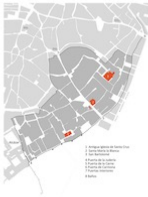
Plano de la judería de Sevilla. Oscar Gil Delgado. "Una sinagoga desvelada en Sevilla: estudio arquitectónico". Sefarad 73 (2013), p. 71