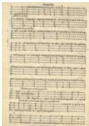
"Para quién crié yo cabellos". Antonio de Cabezón. Luis Venegas de Henestrosa. Libro de cifra nueva para tecla, arpa y vihuela (Alcalá de Henares, Juan de Brocar, 1557), fol. 66v.