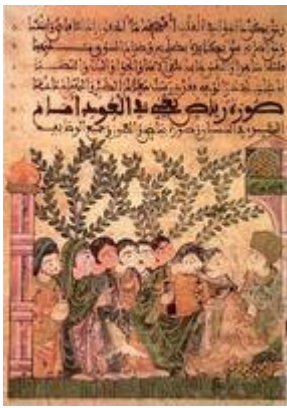
Bay wa Riyad (El cuento de Bayad y Riyad) [Manuscrito Vat. Ar. 368], fol. 9r