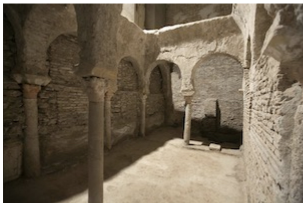
Baños árabes de la mezquita de Ibn Gimara (Colegio de las Mercedarias)