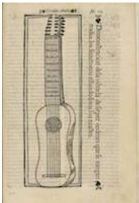
Vihuela. Juan Bermudo. Declaración de instrumentos musicales (Osuna, Juan de León, 1555)