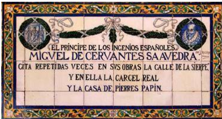
Panel cerámico conmemorativo del III centenario del fallecimiento de Miguel de Cervantes en la calle Sierpes (1916)