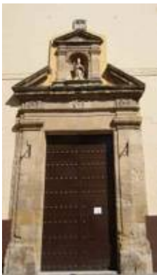
Iglesia de San Nicolas. Algunos datos históricos y artísticos