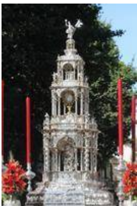
Custodia de la procesión del Corpus Christi (finales del siglo XVII)