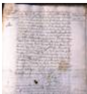
Partida de Casamiento de Diego Velázquez y Juana Pacheco (1618)