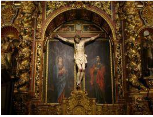
Capilla del Cristo de las Ánimas. Iglesia de San Ildefonso.