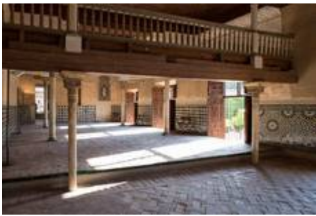
Mexuar y oratorio de la Alhambra