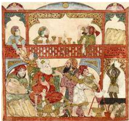
Escena doméstica con laúd