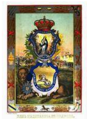
Real Maestranza de Granada. Nobiliario de los señoríos de España, t. IV

https://www.youtube.com/embed/F3xyx40TsJ8?iv_load_policy=3&fs=1&origin=https://www.historicalsoundscapes.com