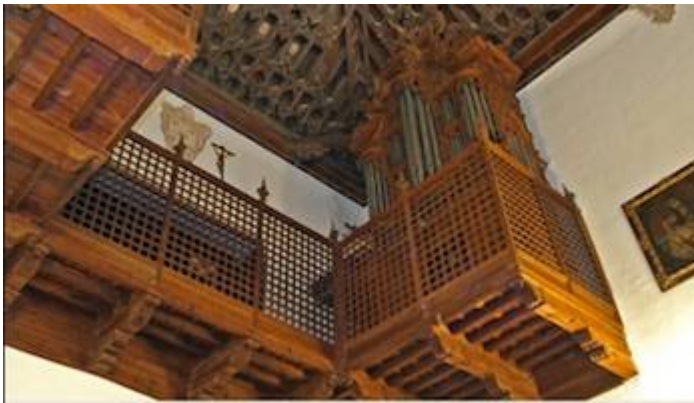
Glosas sobre el canto llano de la Inmaculada Concepción. Francisco Correa de Arauxo. Órgano del convento de Santa Isabel la Real. Organista: Juan María Pedrero Encabo. Concierto de inauguración tras la restauración. Grabación en directo de Julio Muñoz Martín (26/10/2019)