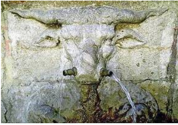
Sonidos del pilar del toro (2). Grabación de Marina López

https://www.historicalsoundscapes.com/recursos/1/5/pilardeltoroplazanuevatomaxymarin-iesalbayzin-ivoox17223760.mp3