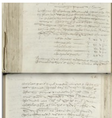
Nónima de ministriles al servicio de la reina Isabel (27 de septiembre de 1501)