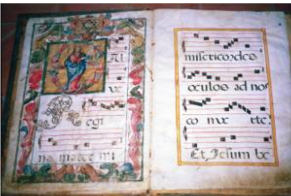
Salve regina. Libro de coro XLII.

"https://embed.spotify.com/?uri=https://open.spotify.com/intl-es/track/0lKEw2p2un89ASGJKGqxn?si=97828f12a38c47fa