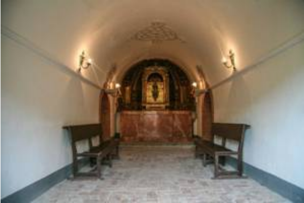
Altar de la Concepción (2). Iglesia de Santiago. Colegiata del Sacromonte.