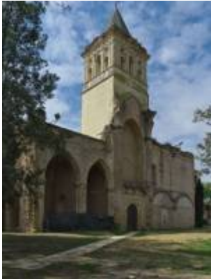
Campanario del convento de San Jerónimo de Buenavista.