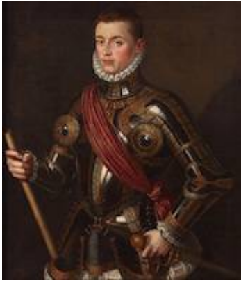
Don Juan de Austria armado. Alonso Sánchez Coello (1567)