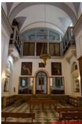
Convento de San Bernardo. Iglesia.