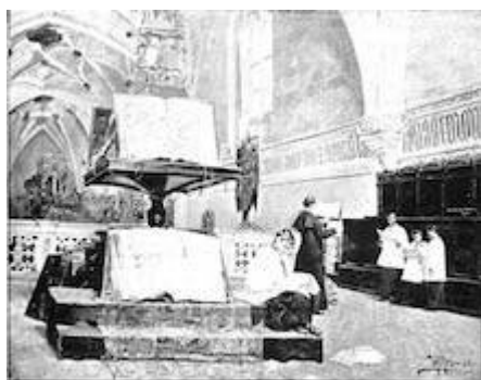
La Real Capilla de Granada.

(Grabado de A. Bernal Rubio, publicado en la Exposición de Granada.)