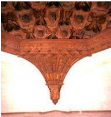
Bóveda del crucero de la iglesia del convento de la Merced (2)