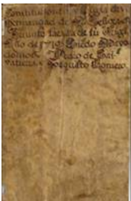
Constituciones y Regla de la Hermandad de Nuestra Señora del Triunfo (1719)