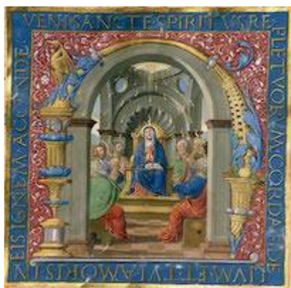
Letra inicial N. Pentecostes. Libro de coro 7 (39), fol. 4v. Juan Ramírez (1522)