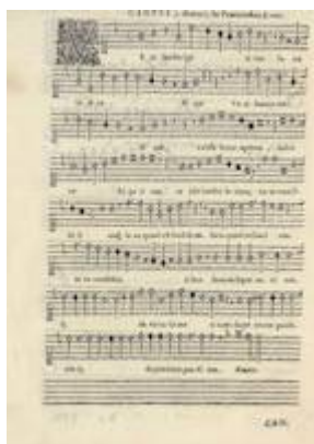
Veni Sancte Spiritus . Tomás Luis de Victoria. Missae, magnificat, motecta, psalmi et alia quam plurima (Madrid, 1600), fol. 15v.