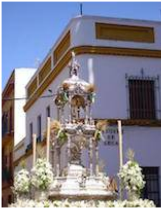
Custodia de la procesión del Corpus Christi en Triana (1712-1726).