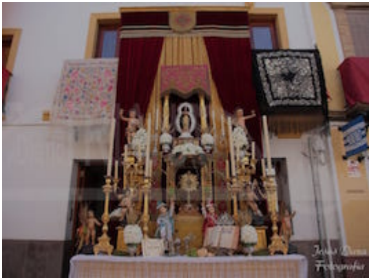
Altares y adornos. Procesión del Corpus Christi en Triana (2018).