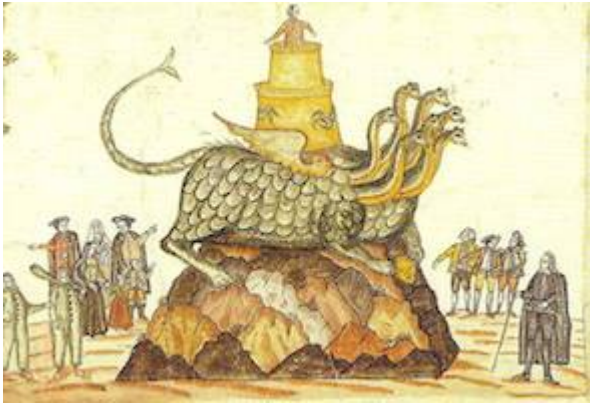
Tarasca (c. 1780)