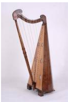
Arpa. Juan López de Toledo (c. 1700). Copia de Javier Pérez de León