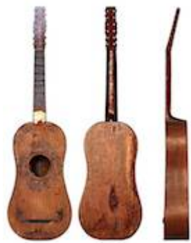
Vihuela de Mariana de Jesús (siglo XVII)