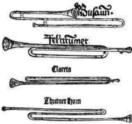
Trompetas. Musica getuscht und angezogen . Sebastián Virdung (1511)