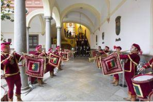
Trompetas de la ciudad de Granada