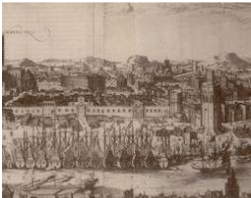
Vista del río Guadalquivir y del Arenal desde Triana (detalle de las Atarazanas). Johannes Janssonius (1617)