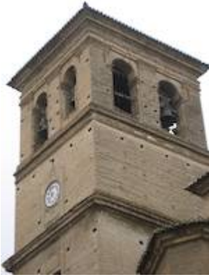
Campanario de la iglesia del Salvador (2).