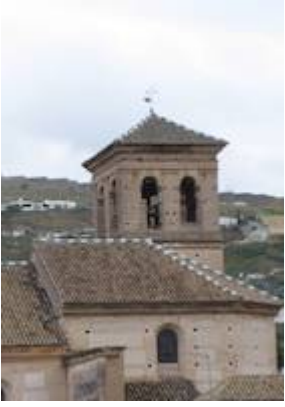
Campanario de la iglesia del Salvador (1).