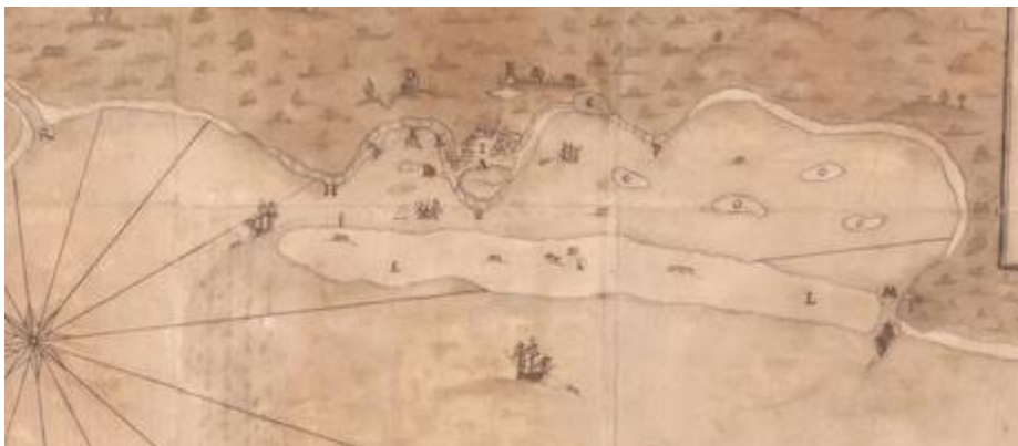
Luanda (siglo XVII)